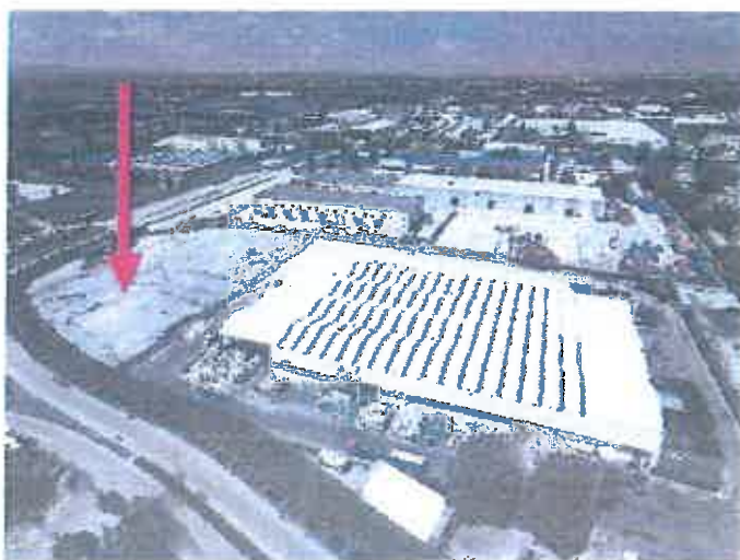
Foto n° 1 - il piazzale sgombrato dai "combustibili" al 03.06.2019

CORBO BENI IMMOBILI S.R.L. Corso Lucilio 176 81037 Sessa Aurunca (CE) P. Iva: 03245400613