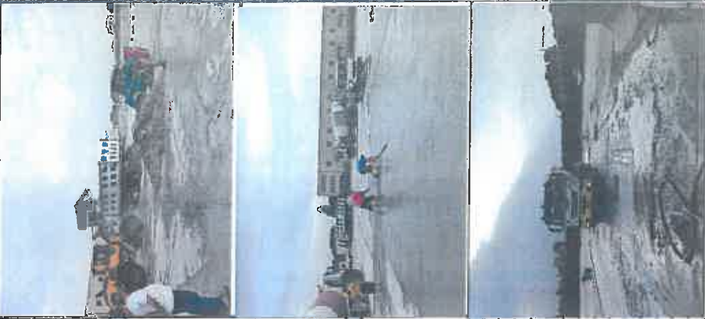
FOTO DEL CANTIERE