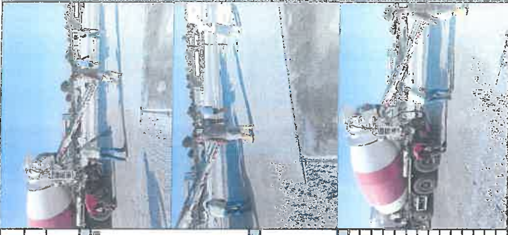
FOTO DEL CANTIERE