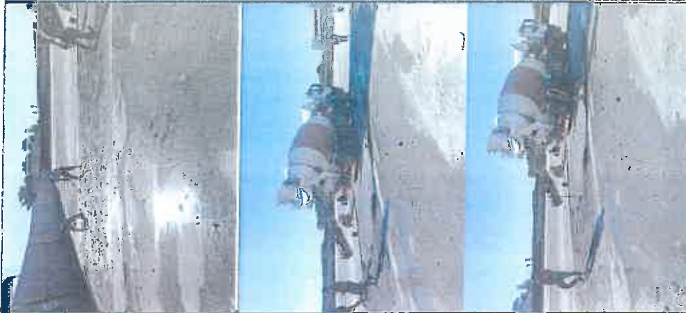
FOTO DEL CANTIERE