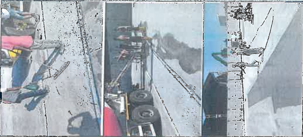
FOTO DEL CANTIERE