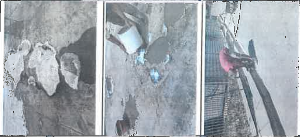
FOTO DEL CANTIERE