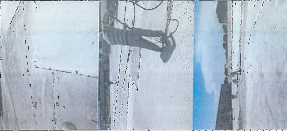
FOTO DEL CANTIERE