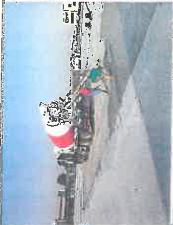
FOTO DEL CANTIERE

3059/19 Piancrete 25kg kg 25,00 Lampitelli srl