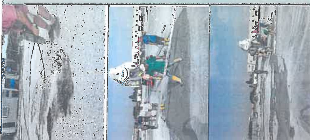
FOTO DEL CANTIERE