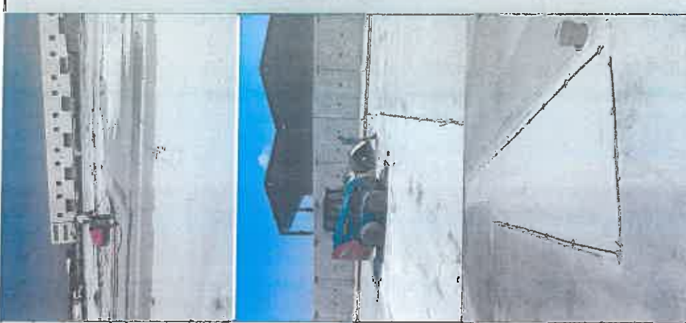
FOTO DEL CANTIERE