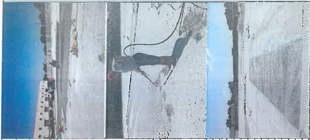
FOTO DEL CANTIERE