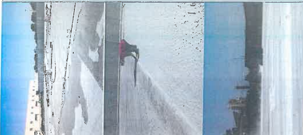
FOTO DEL CANTIERE